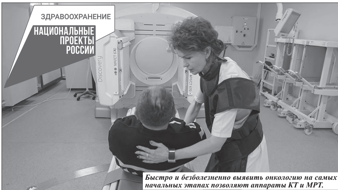
Быстро и безболезненно выявить онкологию на самых начальных этапах позволяют аппараты КТ и МРТ.

Помимо федерального финансирования, средства на такую модернизацию выделяет и областная бюджет. МРТ и КТ для брянской поликлиники № 1, к примеру, обошлись ему почти в 100 миллионов рублей, уточнила главный внештатный специа-