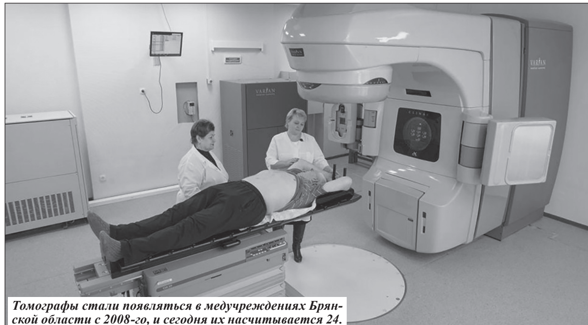
Томографы стали появляться в медучреждениях Брянской области с 2008-го, и сегодня их насчитывается 24.

Но есть и другой момент. Томографы рассчитаны на определённую нагрузку — в современных аппаратах стол выдерживает до 220 килограммов, но при меньшей массе и больших объёмах туловища пациента он может просто не пройти в так называемый тоннель установки. Тогда в качестве альтернативы применяют другие методы исследования.